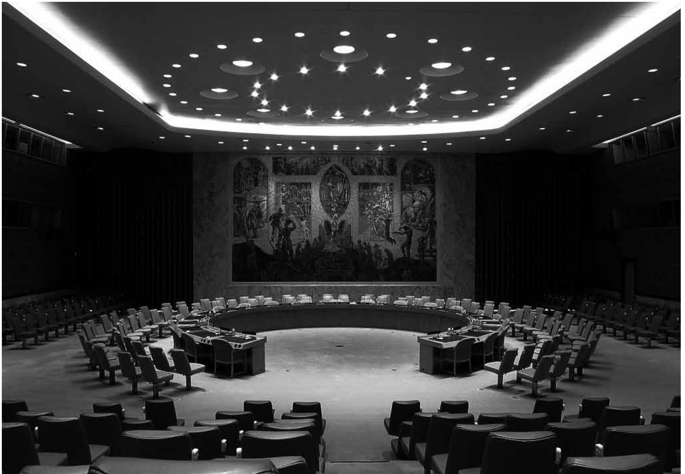
Vergaderzaal van de Veiligheidsraad