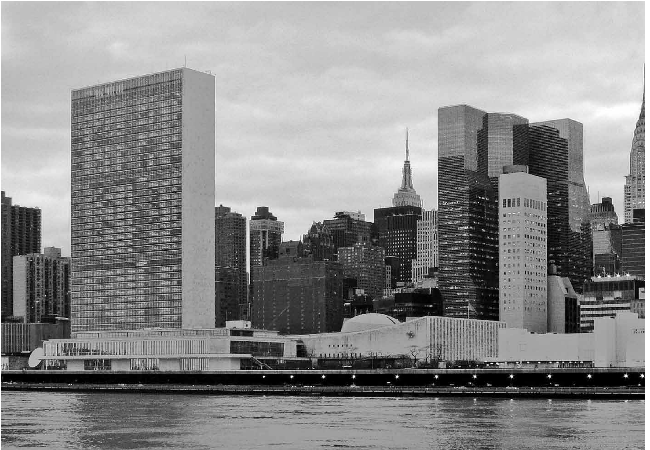
Hoofdkantoor van de Verenigde Naties in Nieuw York