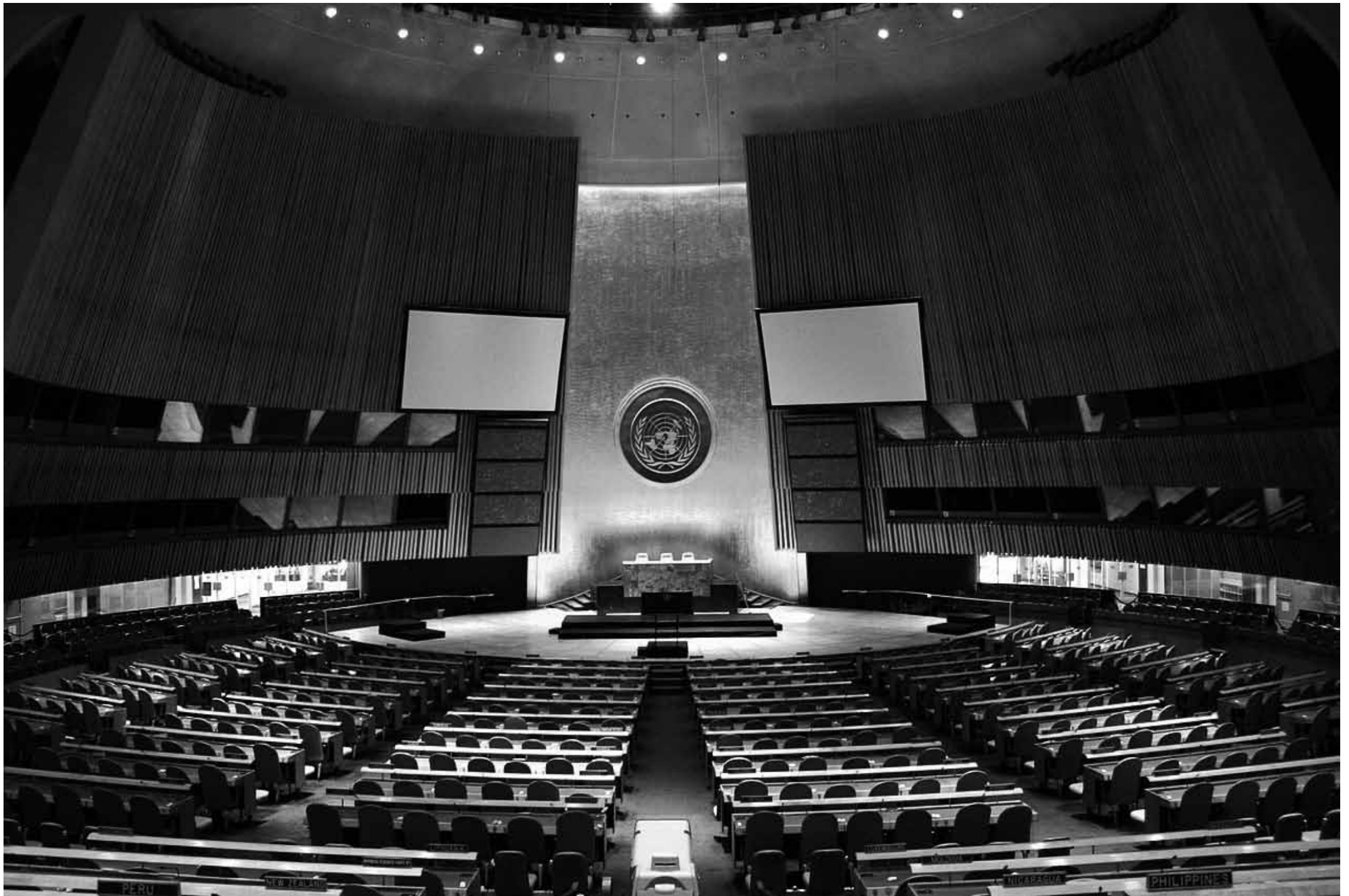
Vergaderzaal van de Algemene Vergadering van de Verenigde Naties